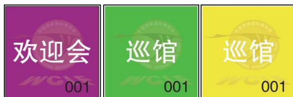
巡馆 A 贴 巡馆 B 贴

开幕式 C 贴：可进入会议中心上班工作，及会场外公共区域，不能进入成都厅及所有休息室。