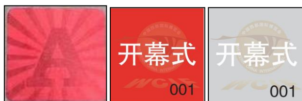
开幕式 A 贴 开幕式 B 贴 开幕式 C 贴

开幕式 A 贴：206 杜甫草堂厅、207 天府厅、成都厅 VIP 嘉宾区域，及其他所有区域。